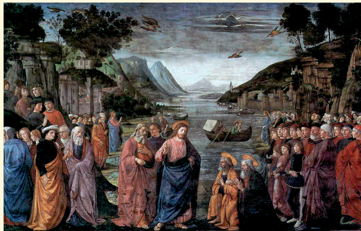
Domenico Ghirlandaio, La Vocazione dei primi apostoli (1481-1482), Cappella Sistina, Vaticano

“Dalla protezione di Pietro e Paolo, carissimi, a noi divinamente largita per essere un esempio di pazienza ed un sostegno della fede, noi dobbiamo senza dubbio rallegrarci quando facciamo memoria di tutti i Santi ma abbiamo motivo di gloriarci per l'eccellenza di tali Padri.